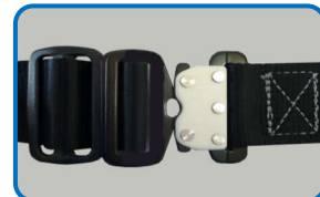
胸・もも ワンタッチバックル

品番: 3PHNW カラー: ブラック・ブルー・レッド/ブラック ● 胸・ももバックル 薄型ワンタッチ式（スチール+アルミ製） 質量: Mサイズ1100g・Lサイズ1130g・LLサイズ1160g