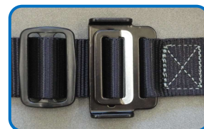
胸・もも 差込み式バックル