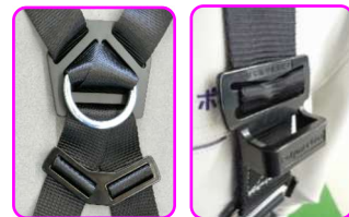
背中X型配置 フックハンガー