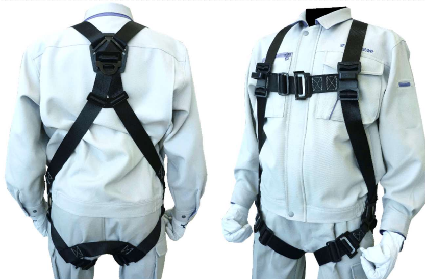
胸・もも 差込み式バックル