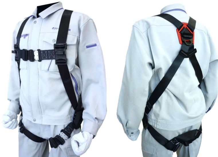
胸・もも ワンタッチバックル