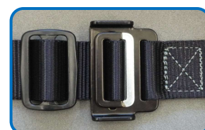
胸・もも 差込み式バックル

品番: 3PHN カラー: ブラック・ブルー・レッド/ブラック ● 胸・ももバックル スチール製差込み式 質量: Mサイズ1070g・Lサイズ1100g・LLサイズ1130g ・軽量でお求めやすい差込み式バックルを採用