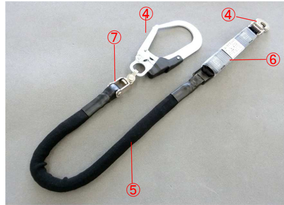
※掲載画像の仕様・形状等は一例です